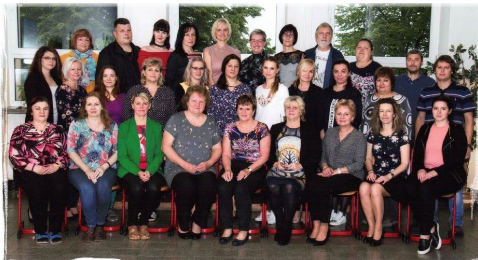
ZŠ a MŠ A. Jiráska, Dolní Lutyně 2018 - 2019