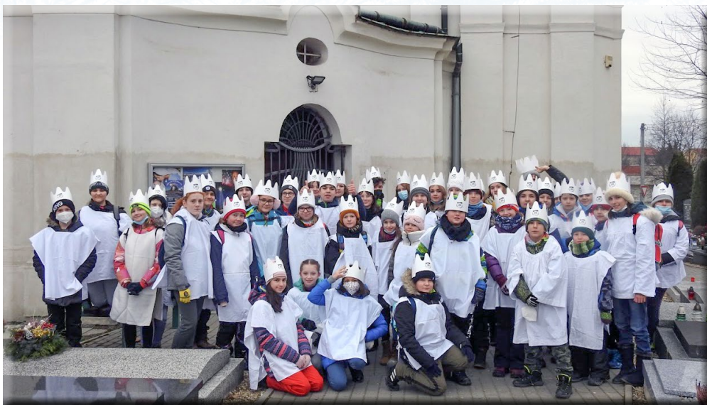
Po slavnostním zahájení Tříkrálové sbírky