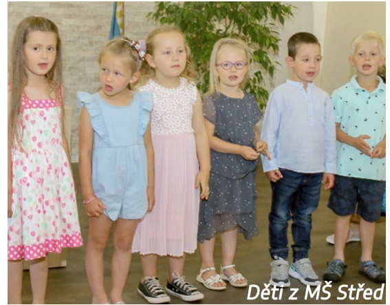
Děti z MŠ Střed