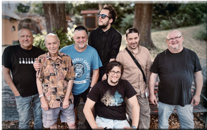
Ostravská kapela Buty