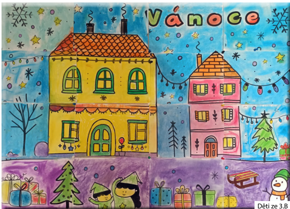
Děti ze 3.B