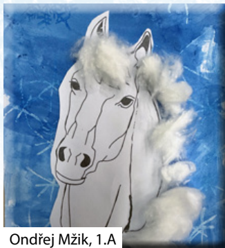
Ondřej Mžík, 1.A