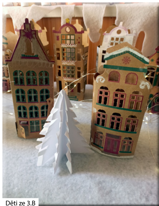
Děti ze 3.B