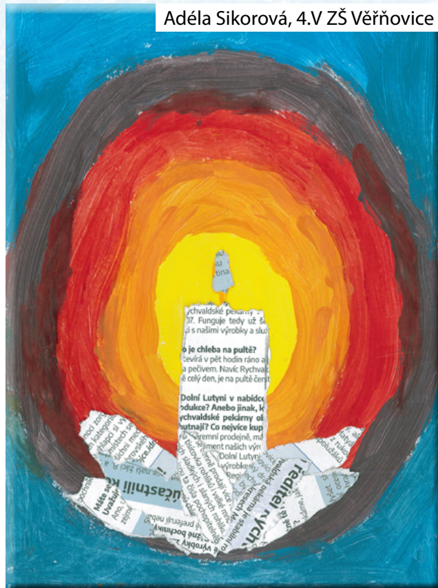
Adéla Sikorová, 4.V ZŠ Věřňovice