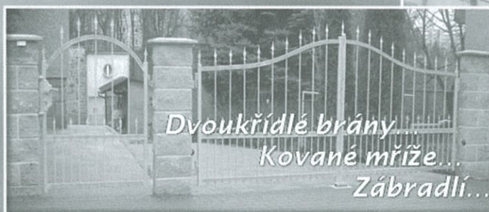
Dvoukřídlé brány... Kované mříže... Zábradlí...

Dále zajišťujeme: práce s polykarbonátem, kovaný nábytek, kovovýroba