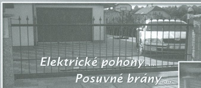
Elektrické pohony... Posuvné brány...