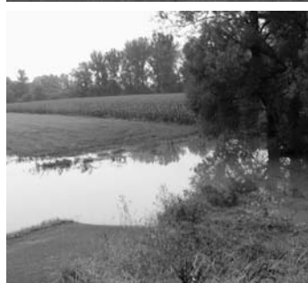
Povodně ve Věřňovicích